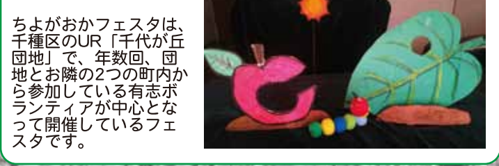
ちよがおかフェスタは、千種区のUR「千代ヶ丘団地」で、年数回、団地とお隣の2つの町内から参加している有志ボランティアが中心となって開催しているフェスタです。

【日時】 5月27日(土) 13:00開演 【会場】 UR千代ヶ丘団地106棟集会所洋室 【定員】 30人 (予約制) 【料金】 無料